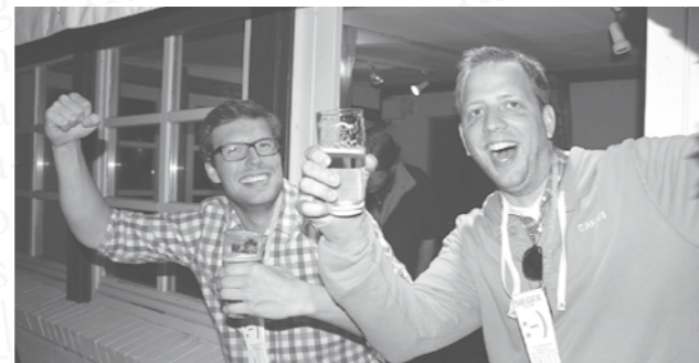
Zwei der Kicker-Sieger auf dem „Fest Der Lietzer“

Spiekeroog aktiven Lietzern und uns, den Altbürgern, also ebenfalls Spiekerooger Lietzern, die aber in ganz Deutschland und der Welt verstreut leben. Während die Mitglieder des Schulvereins einer ständigen Fluktuation unterliegen und von Jahr zu Jahr wechseln, bleiben unsere Mitglieder uns in der Regel viele